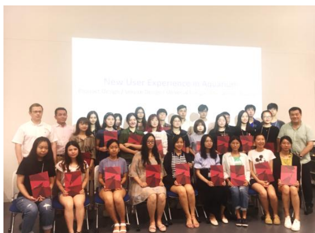
(往届线下课程结业证书颁发现场)